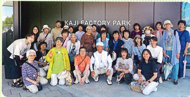
カジファクトリーにて