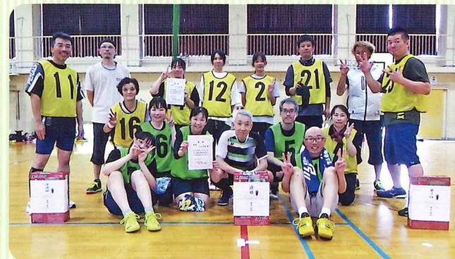
入賞チームの皆さん