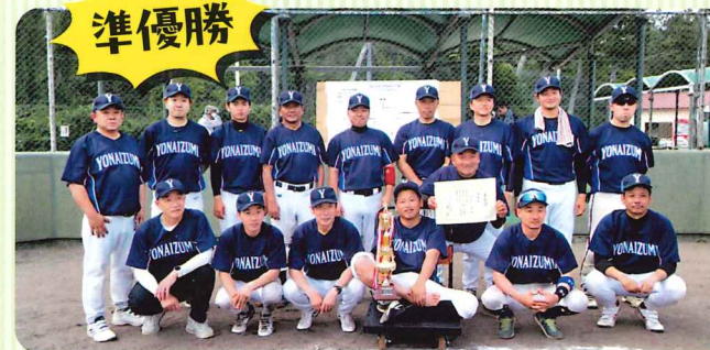
米泉ソフトボール部