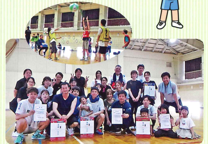
入賞チームの皆さん