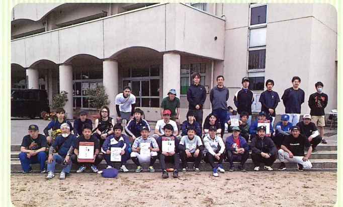
入賞町会の皆さん