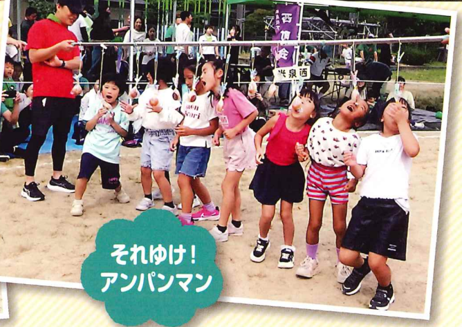
それゆけ! アンパンマン