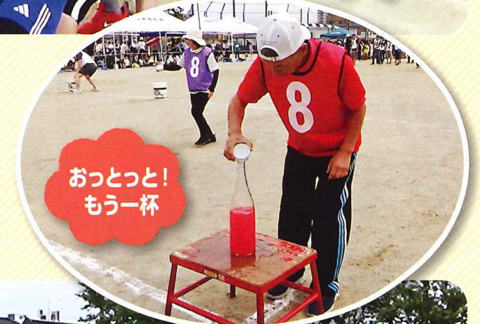
おっとっと! もう一杯