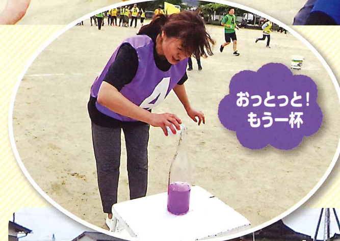
おっとっと! もう一杯