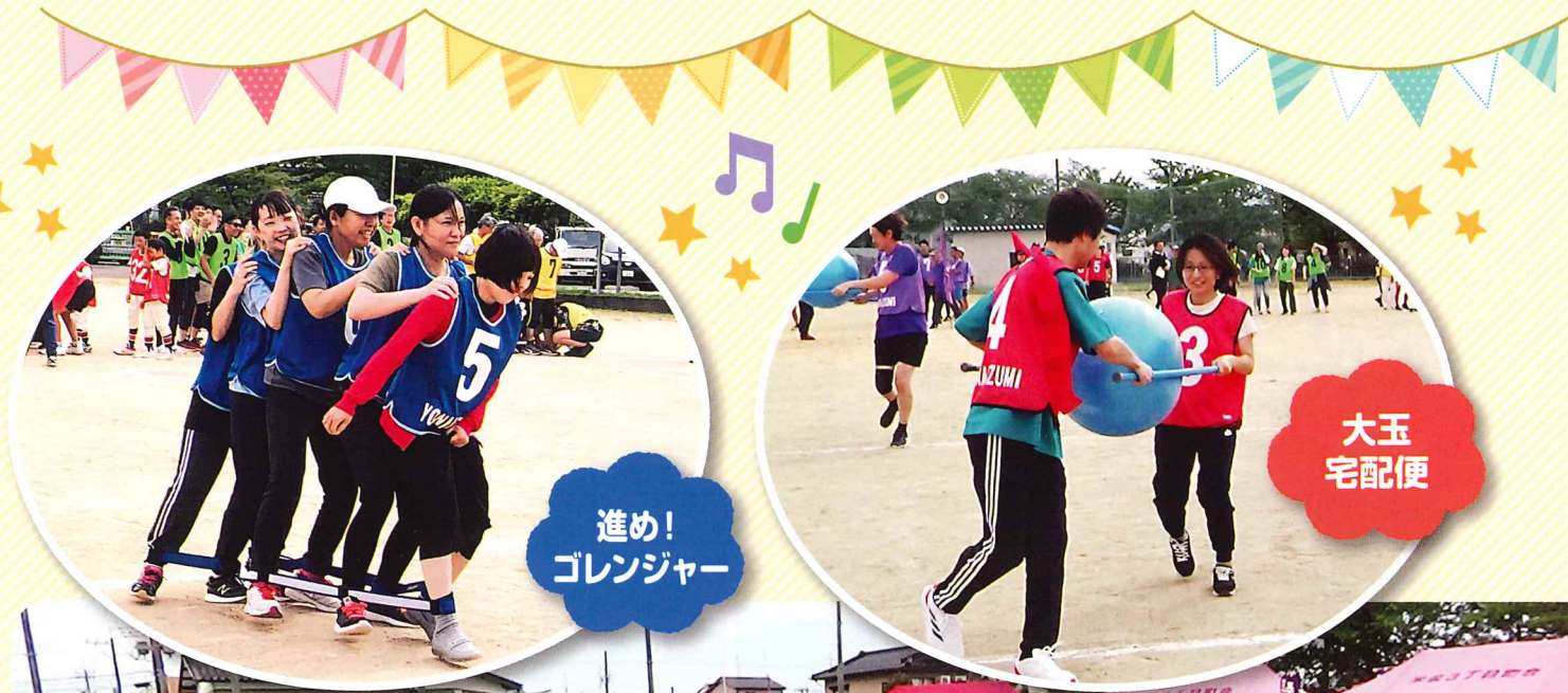
進め! ゴレンジャー