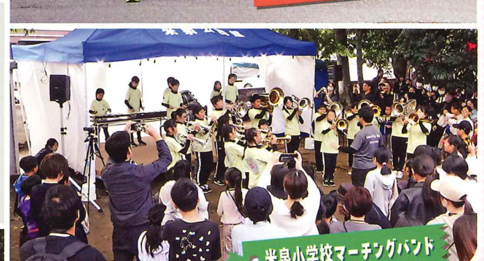
米泉小学校マーチングバンド