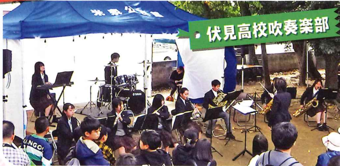
伏見高校吹奏楽部