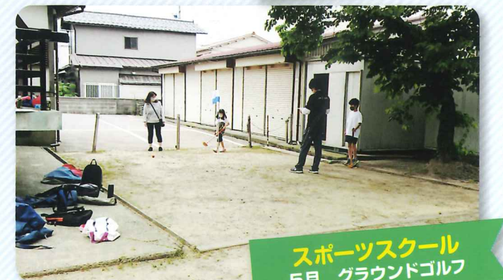
スポーツスクール 5月 グラウンドゴルフ