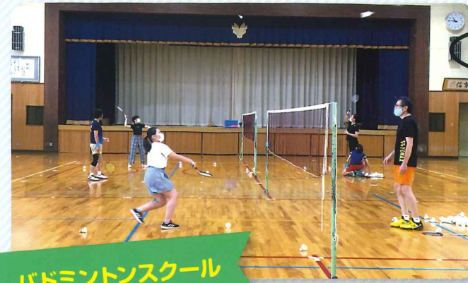
バドミントンスクール

令和4年度から新たに「五色百人一首クラブ」も始まりました！ 入会を希望される方は、米泉公民館までお問い合わせください。(TEL241-8924)