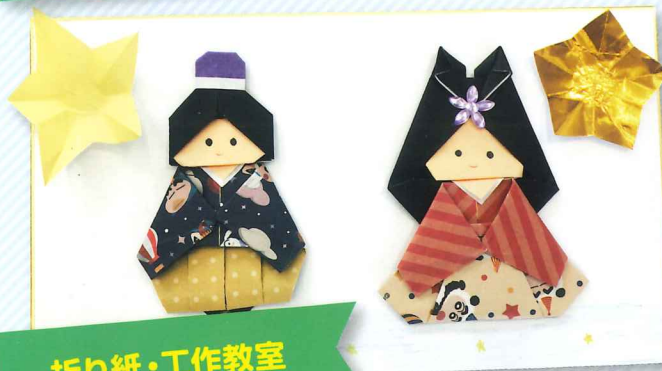
折り紙・工作教室

令和4年度から新たに「五色百人一首クラブ」も始まりました！ 入会を希望される方は、米泉公民館までお問い合わせください。(TEL241-8924)