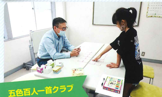
五色百人一首クラブ