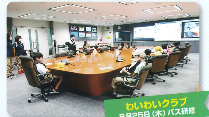
わいわいクラブ 8月25日(木) バス研修