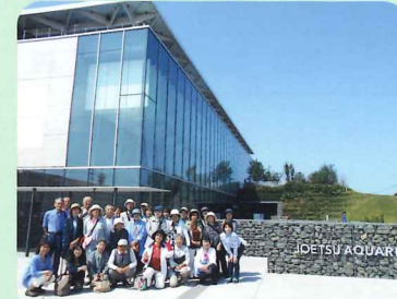
上越水族館「うみがたり」

新潟県の上越水族館「うみがたり」を見学しました。イルカショーやペンギンの餌やり体験、白イルカのレクチャーなど、童心に帰って水族館を楽しみました。