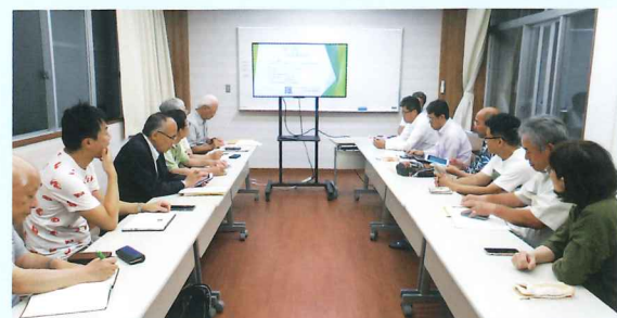
ICT推進委員会の様子

『結ネット』の導入の仕方がわからない方は、各町会の町会長さんにお問合わせください。