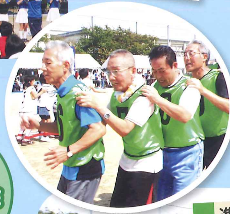
進め! ゴレンジャー