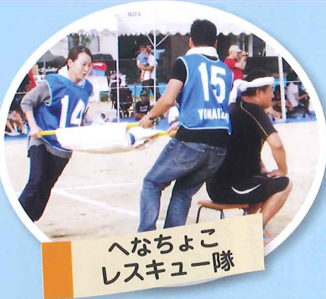
へなちょこレスキュー隊