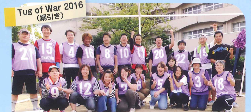
Tug of War 2016 (綱引き)