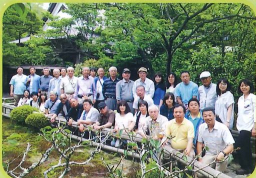
大原の里 宝泉院にて