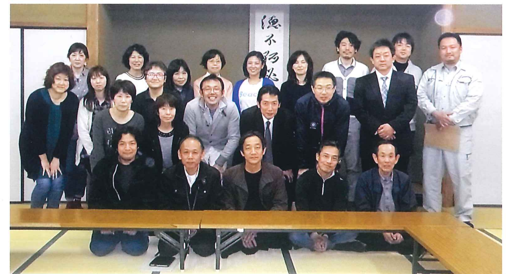
平成28年度 公民館役職員