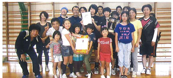
優勝 西泉町会の皆さん