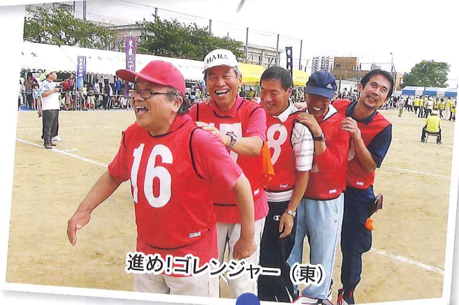
進め!ゴレンジャー (東)