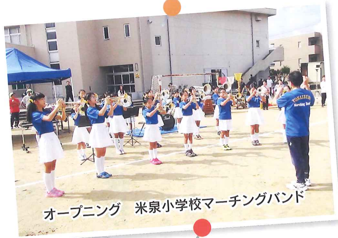
オープニング 米泉小学校マーチングバンド