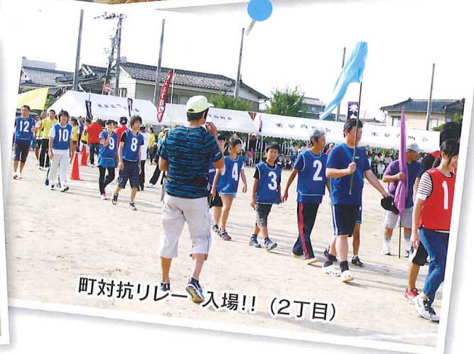
町対抗リレー入場!! (2丁目)