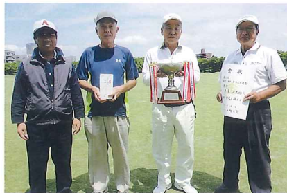
優勝した米泉Aチーム