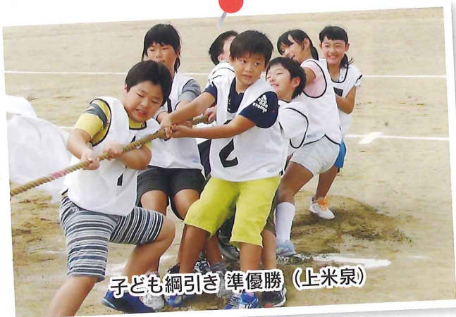
子ども綱引き 準優勝 (上米泉)