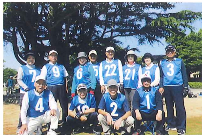
米泉チームの皆さん