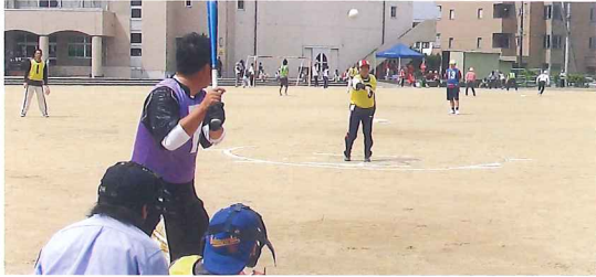
西泉町会 対 3丁目町会