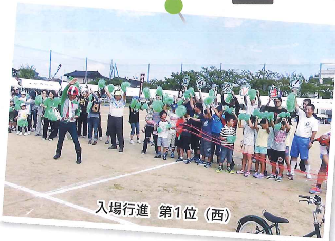
入場行進 第1位 (西)