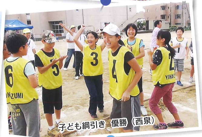
子ども綱引き 優勝 (西泉)