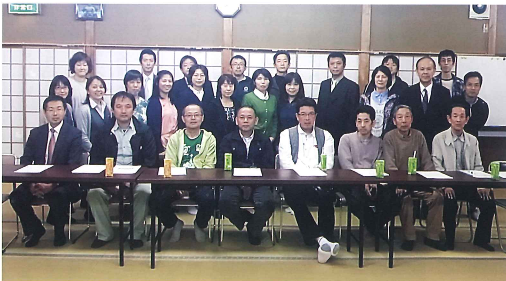
平成27年度 公民館委員