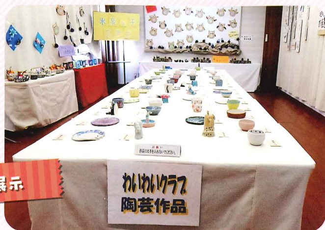
かゆいけろ 陶芸作品