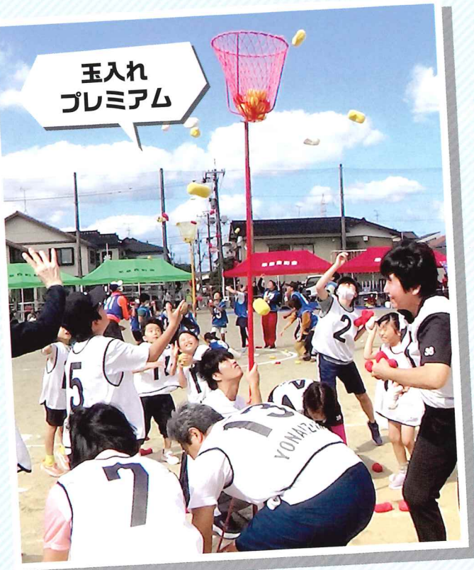
玉入れ プレミアム