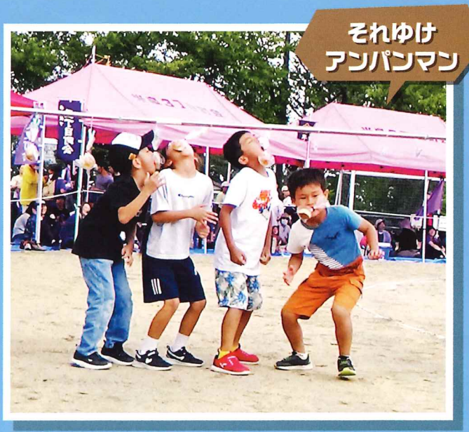
それゆけ アンパンマン