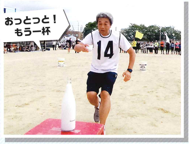
おっとっと! もう一杯