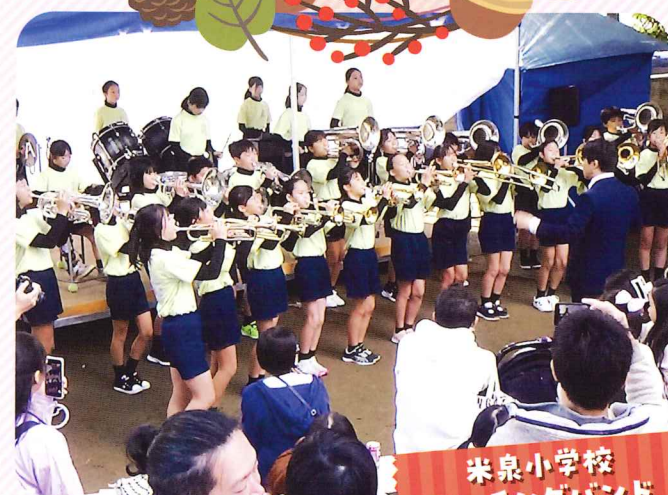
米泉小学校 マーチングバンド