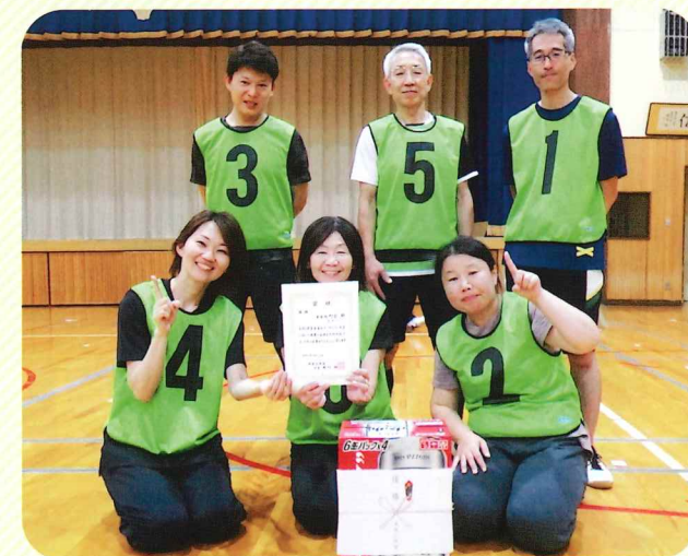
優勝 西町会Aチーム