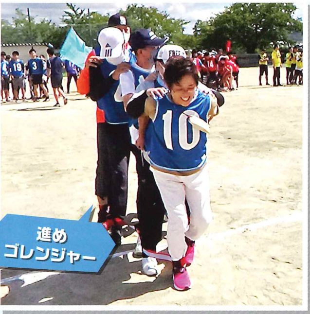
進め ゴレンジャー