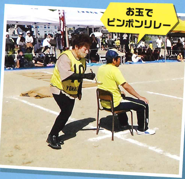
お玉で ピンポンリレー