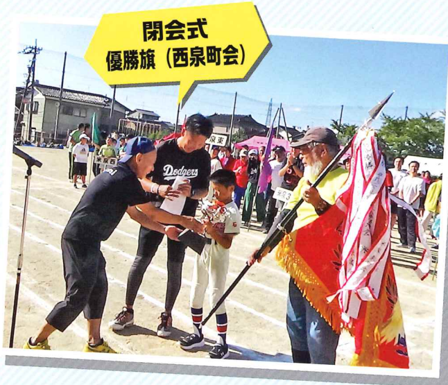
閉会式 優勝旗 (西泉町会)