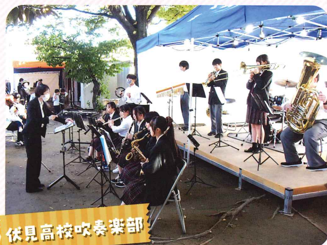
伏見高校吹奏楽部